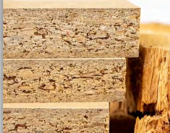
CORE CHIPBOARD الواح الشيببورد