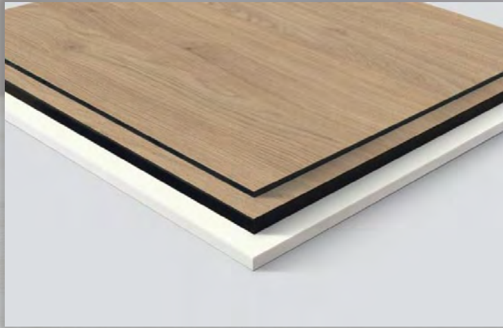
CPL AND COMPACT LAMINATES اللامينيت