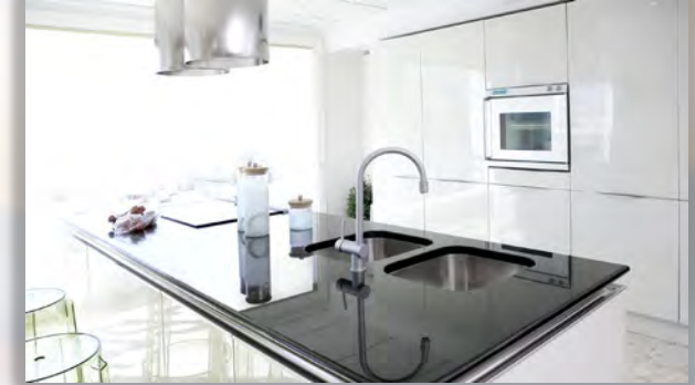
EB & NANOTECHNOLOGY SURFACES تقنية النانو وشعاع الإلكترونات