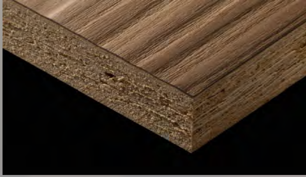
MFC [MELAMINE FACED CHIPBOARDS] شيببورد الميلامين

تقدم شركة WPC مجموعة واسعة من الأخشاب المعالجة عالية الجودة المستوردة من إيطاليا وتركيا وألمانيا ومنتجات بتقنيته عالية من الصين. بعض المنتجات المتوفرة هي: