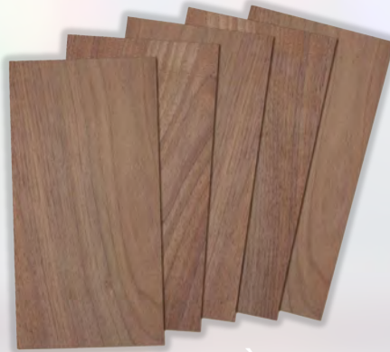
SINGLE FACED MELAMINE MDF لوح ميلامين MDF على وجه واحد